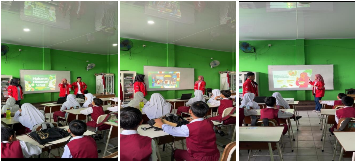
Gambar 2, 3 dan 4. Pemberian Materi Makanan dan Minuman Sehat

yang menarik minat mereka dan memperkuat pemahaman mereka dengan lebih baik dibandingkan hanya melalui presentasi satu arah.