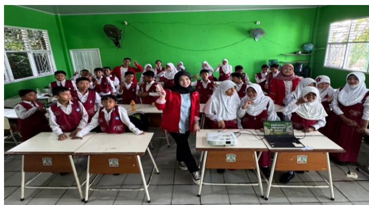
Gambar 8. Sesi Foto Bersama Dengan Siswa/i 012 Balikpapan Kota