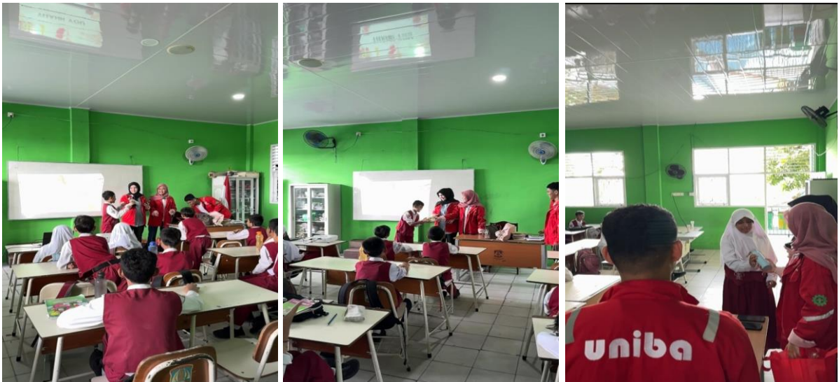
Gambar 5, 6 dan 7. Pemberian Hadiah Sebagai Bentuk Apresiasi Bagi Siswa/i yang Aktif